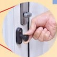
Slider adjust/ Locker ปุ่มปรับ/ล็อกบานเลื่อน