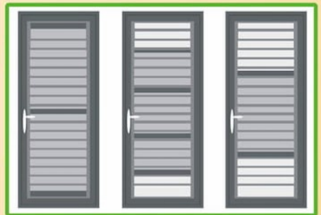
Closed Half Opened Fully Opened